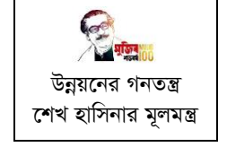
উন্নয়নের গনতন্ত্র শেখ হাসিনার মূলমন্ত্র